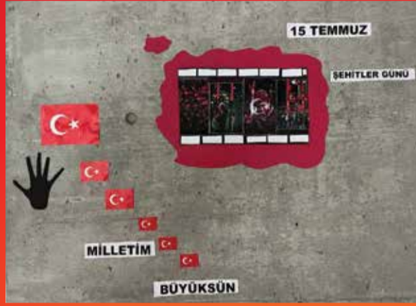
Nilda KESTANE 8/E