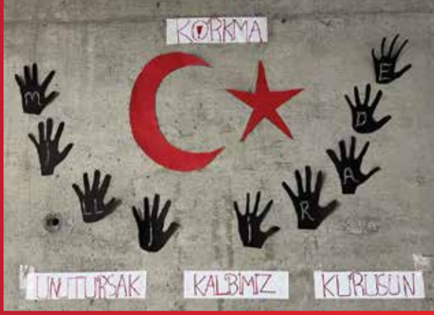
Semirhan ELEMEN 8/E