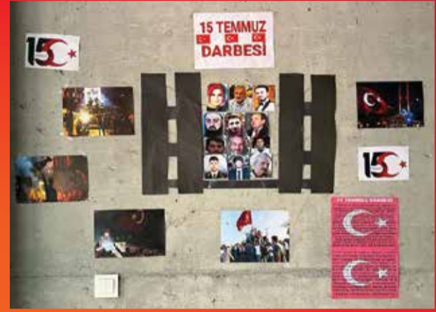
Cana HALFED 8/E