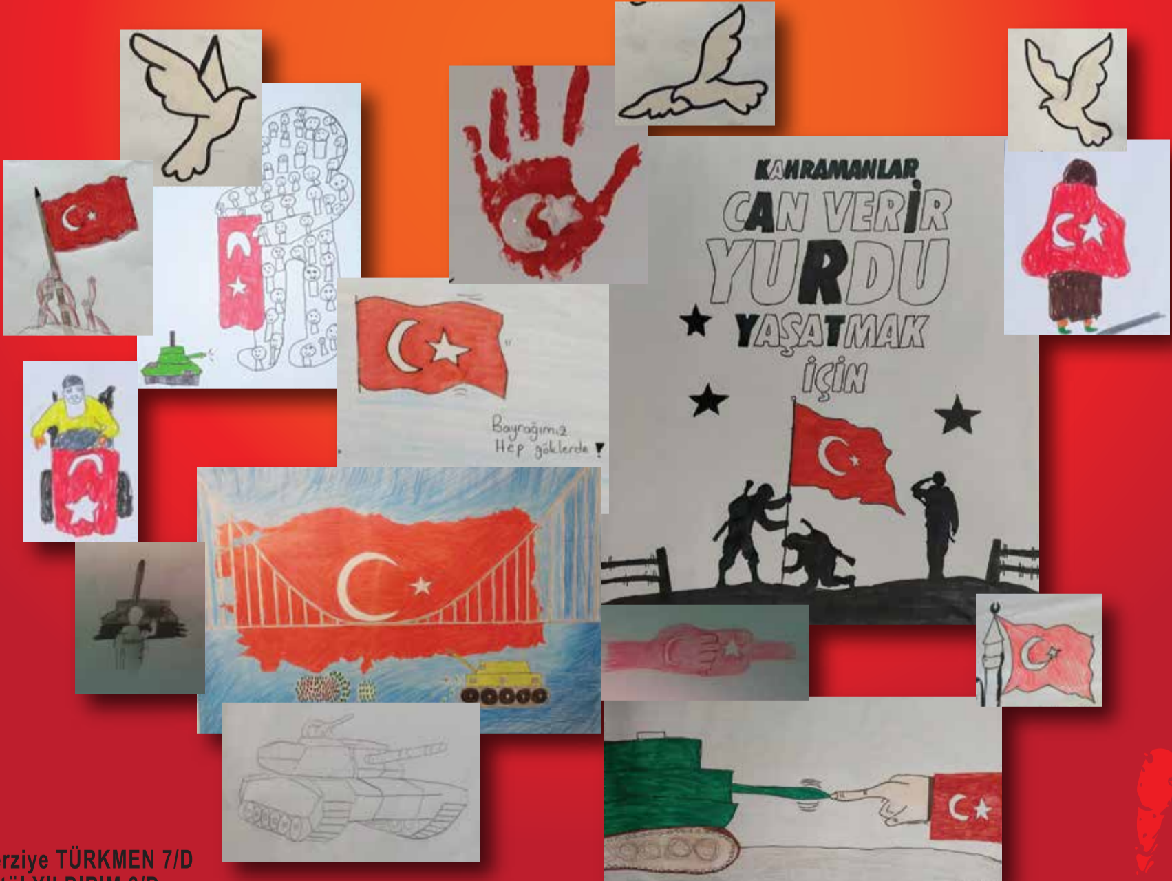
Merziye TÜRKMEN 7/D Betül YILDIRIM 8/D Abide YAKUP 8/E Fevziye ULUS 8/E