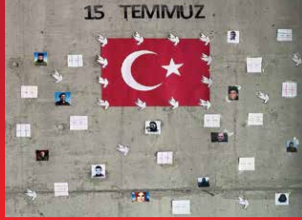
Zeynep ALBAYRAK 8/E